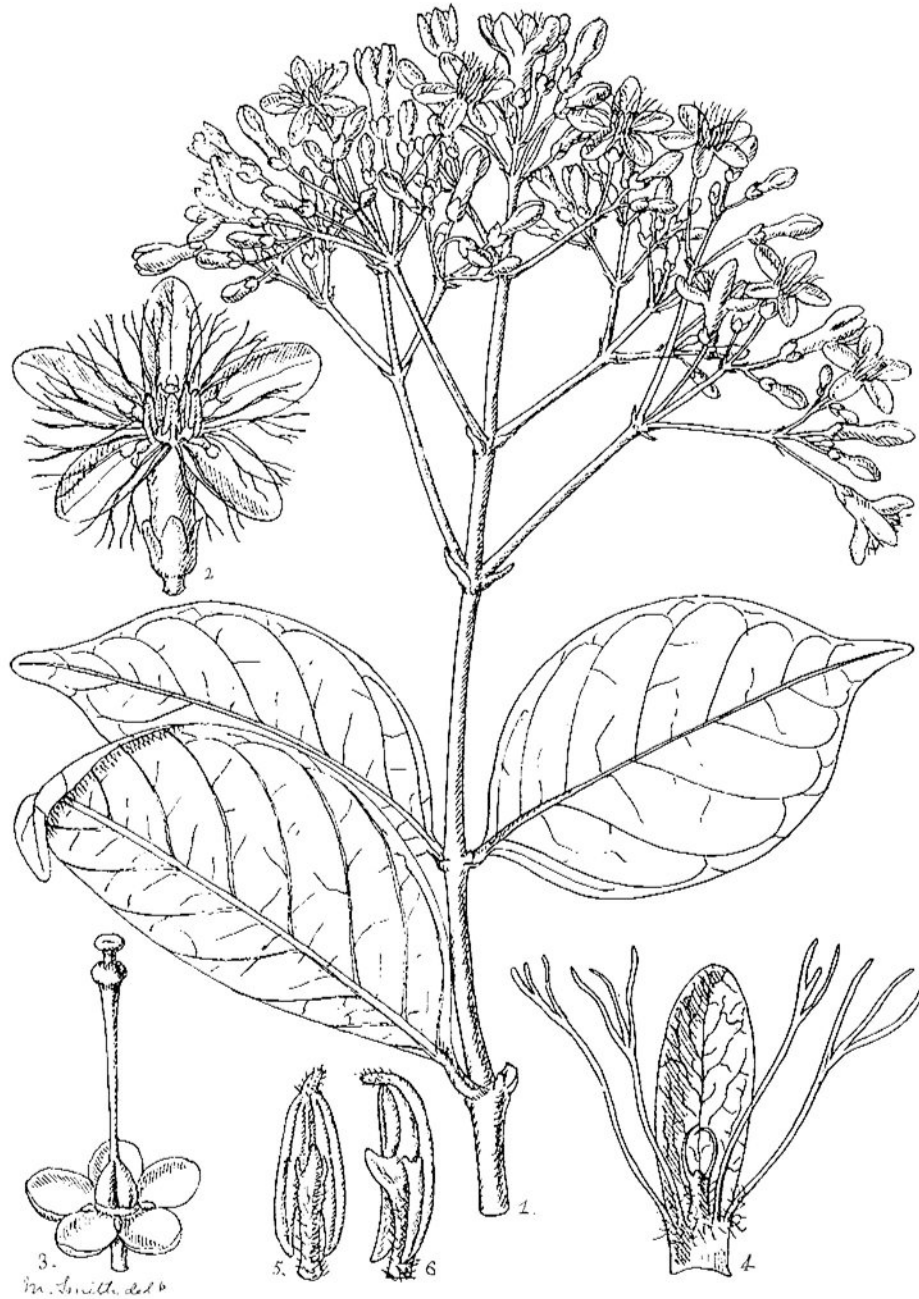
259. PLEIOCERAS WHYTEI